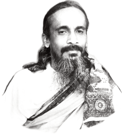
Kavi Yogi Shuddhananda Bharati